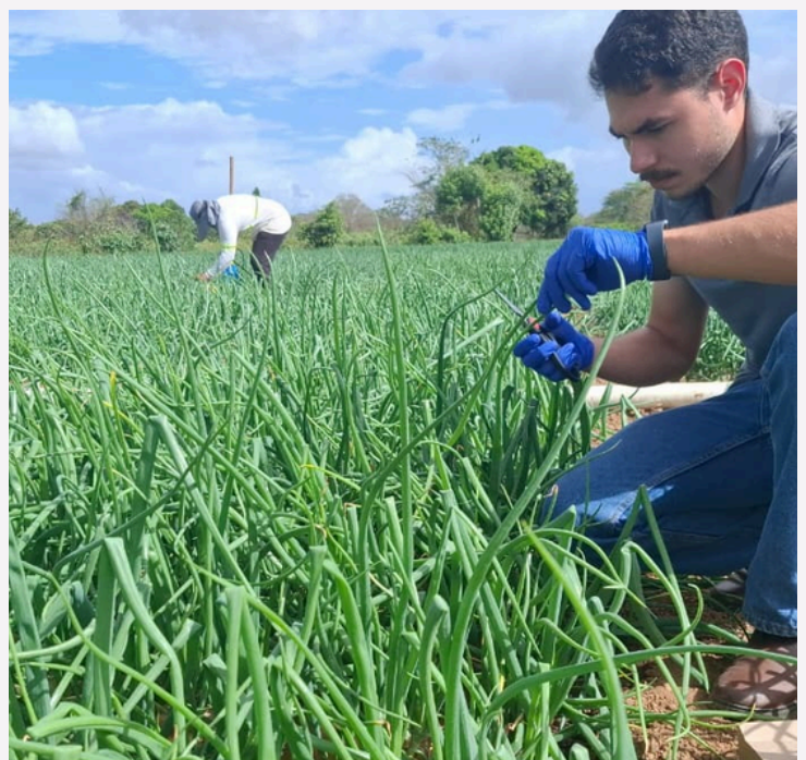
Figura 1. Visita de seguimiento a productores de cebolla CIAPCP-AIP

Para que una finca sea económicamente sostenible, no basta con producir mucho; hay que producir con eficiencia. Muchos productores de nuestra región trabajan arduamente en sus parcelas de cultivo, pero al final de la cosecha no saben con certeza cuánto dinero ganaron o perdieron realmente. El análisis económico no es solo para expertos; es una herramienta que le permite a usted, amigo productor, saber si la tecnología que está usando le devuelve cada centavo invertido. En este boletín, aprenderemos a llevar un "cuaderno de campo" que sea su mejor guía para el éxito