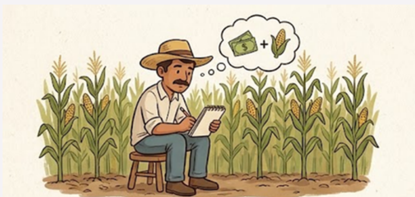
Figura 1. El registro de datos: La base de una finca exitosa.

Se recomienda que el registro se haga al momento. No espere a que termine la semana para anotar lo que gastó, ya que la memoria suele fallar. Use un lápiz para que pueda corregir cualquier error.